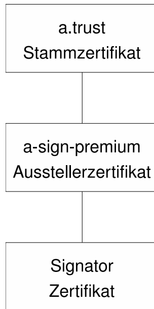
Abbildung 1: Zertifizierungshierarchie

Abbildung 1 zeigt eine schematische Darstellung der Zertifikatshierarchie.