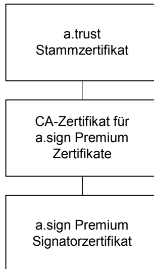
Abbildung 1 Zertifizierungshierarchie