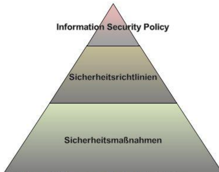
Abbildung 1 Informationssicherheits-Architektur

In der Informationssicherheits-Architektur wird festgelegt, wie die Informationssicherheit beim Unternehmen umgesetzt wird.